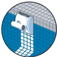
Καθαρισμός της ίσαλο γραμμής

Ασύρματο τηλεχειριστήριο για πλοήγηση αφής στις επιλογές χρόνου κύκλου λειτουργίας